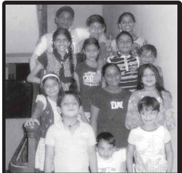
കോട്ടപ്പുറം കുന്നത്തു മനലെയിനിലുള്ള സത്യം അപ്പാർട്ട്മെന്റിലെ ഫ്ളാറ്റിൽ കുട്ടികൾ പെൻസിൽ, റബ്ബർ, പേന തുടങ്ങി കൊച്ചു കൊച്ചു സാധനങ്ങൾ പ്രദർശിപ്പിച്ചും ലേലം ചെയ്തും സ്വരൂപിച്ച 2700/- രൂപ പെയിൻ ആന്റ് പാലിയേറ്റീവ് കെയർ സൊസൈറ്റിയ്ക്ക് നല്കി.

രക്ഷാചെലവിൽ ഒരു ശതമാനം മാത്രമാണ് സർക്കാറിന്റെ പങ്ക്. അങ്ങനെ ഇന്ത്യ ലോകത്തിലെ ഏറ്റവും മോശമായ ആരോഗ്യ പരിരക്ഷാസംവിധാനമുള്ള ഹെയ്തിയുടേയും സിയേറാ ലിയോണിന്റേയും കൂടുതലിൽ കൂടും. വാസ്തവത്തിൽ, ചൈനീസ് സർക്കാർ അവരുടെ ജനങ്ങൾക്ക് വേണ്ടി ചെലവിടുന്നതിന്റെ ഏതാണ്ട് കാൽ ഭാഗമേ ഇത് വരൂ. ചൈനയിൽ രാജ്യത്തിന്റെ മൊത്തവരുമാനത്തിന്റെ 3 ശതമാനമാണ് ആരോഗ്യ പരിരക്ഷയ്ക്ക് നീക്കിവെയ്ക്കുന്നതെങ്കിൽ ഇന്ത്യയിൽ ഇത് 1.2 ശതമാനം മാത്രമാണ്. നമ്മുടെ പ്രാഥമിക ചികിത്സാരംഗവും ഏറെ പരിതാപകരമാണ്. നിലവിലുള്ള വൈദ്യ ഇടപെടലുകളിലും രോഗപ്രതിരോധ ആരോഗ്യ പരിരക്ഷാപരിപാടികളോ പരിഗണിയ്ക്കപ്പെടുന്നില്ല. അഥവാ നിങ്ങളൊരു ദാരുണാവസ്ഥയിലുള്ള രോഗിയാണെങ്കിൽ നിങ്ങളെ ചികിത്സിയ്ക്കാനുള്ള പണം സർക്കാർ സ്വകാര്യ ആസ്ഥാനങ്ങളെയാണ് ഏല്പിക്കുക. തീർച്ചയായും ഇങ്ങനെയല്ല, പൊതുജനാരോഗ്യ പരിരക്ഷ നടപ്പാക്കേണ്ടത്.